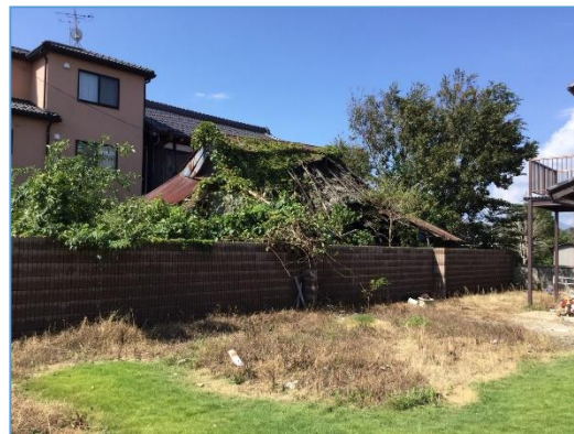
屋根等が崩落している